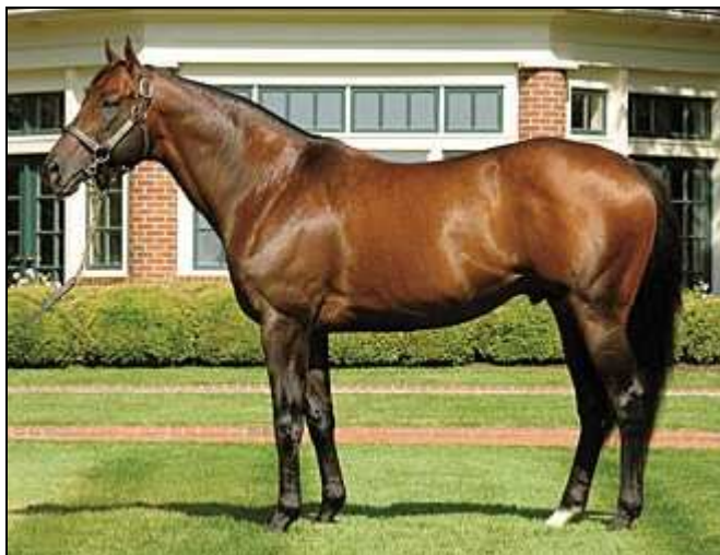
Candy Ride deslumbró en San Isidro y ahora brilla en USA

En el año 2002 cruza triunfal el soberbio Candy Ride (Ride the Rails), nacido en el Haras Abolengo.