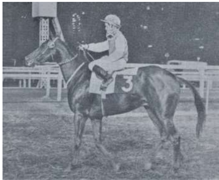
"MUÑECA". De regreso al recinto ganador en uno de sus triunfos internacionales en Cidade Jardim, San Pablo.