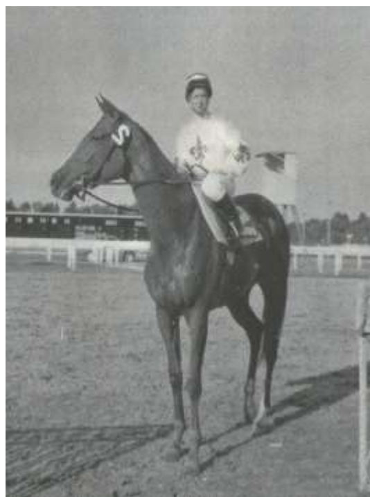
A LA CANCHA. Salida para el paseo preliminar en la arena del Hipódromo Argentino de Palermo.