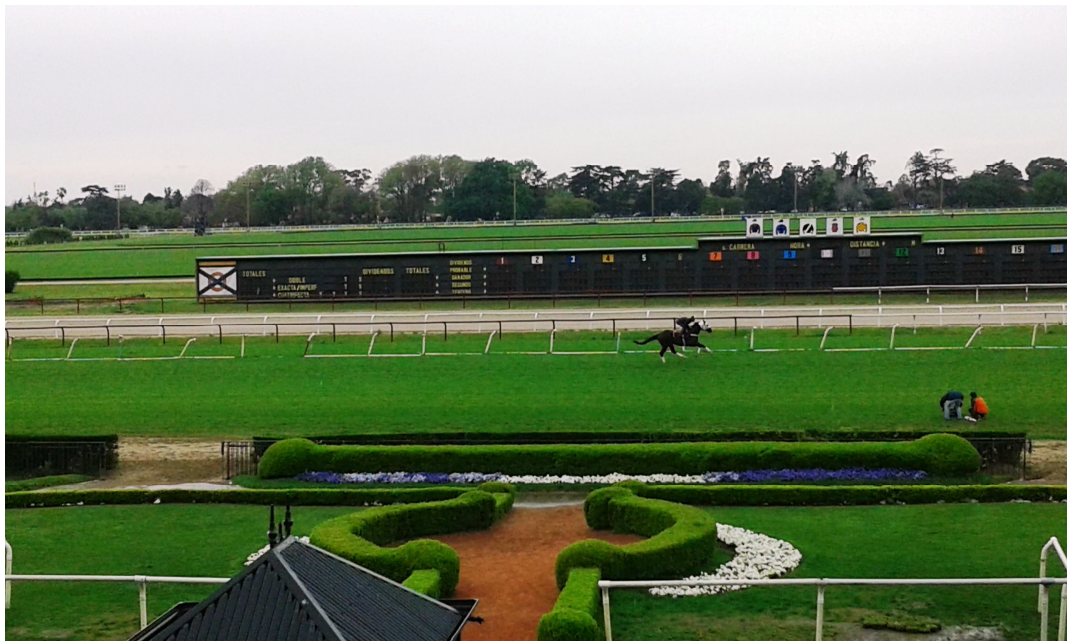
Le Blues hizo reconocimiento de pista en el HSI