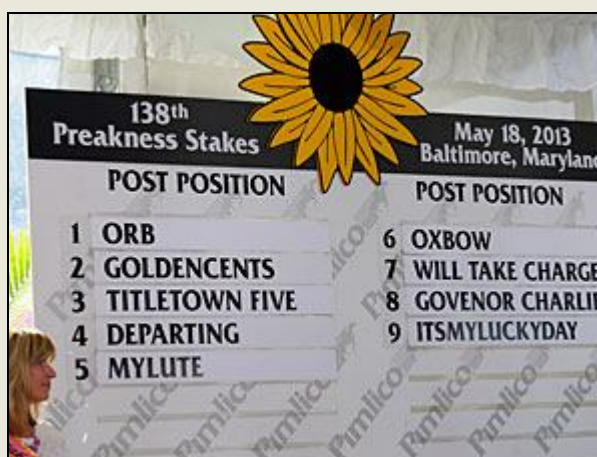
Orden de largada del Preakness Stakes 2013

El sábado 18 de mayo el Hipódromo de San Isidro transmitirá en directo, a las 19.20 horas, el 138° Preakness Stakes (G1 – 1900 metros, US$ 1.000.000) , con apuestas, a través de su señal televisiva. La carrera en la que participarán los mejores ejemplares de tres años de USA integrará la reunión del sábado 18, en San Isidro, dentro un programa que contará con pruebas de jerarquía, tales como el Clásico Velocidad (G3) y el Clásico Southern Halo (G3) . Viva la emoción de la prestigiosa competencia de Maryland, desde Pimlico Race Course (USA) en la pantalla de San Isidro. Disfrute el segundo eslabón de la Triple Corona de USA , serie que se completa con el Kentucky Derby (G1) , corrido el pasado 4 de mayo; y el Belmont Stakes (G1) , a disputarse dentro de tres semanas. A continuación se brinda un perfil de los nueve participantes que tendrá la prueba y en la siguiente imagen figura el Orden de Partida.